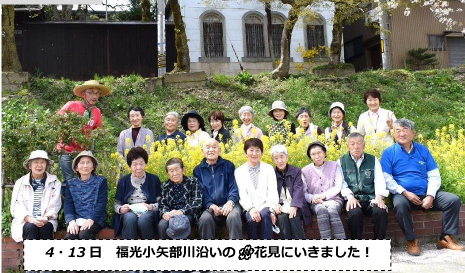
4・13 日 福光小矢部川沿いの花見にいきました！