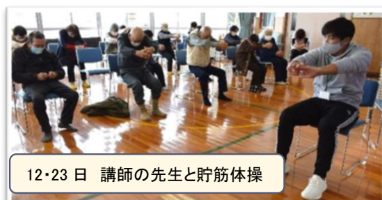
12・23日 講師の先生と貯筋体操