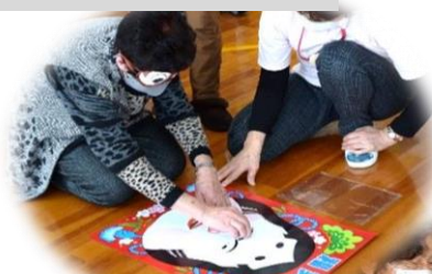
1・6日 福笑いゲーム