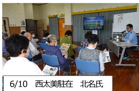
6/10 西太美駐在 北名氏