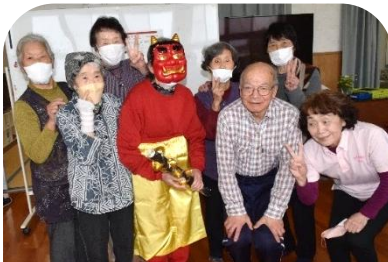
4/22 鬼の着せ替えゲームや宝さがしゲーム