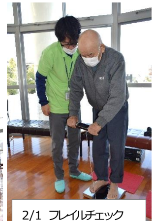
2/1 フレイルチェック 包括支援センター