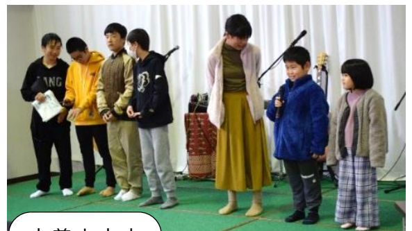
太美山小中学生が、今頑張っている事を発表しました