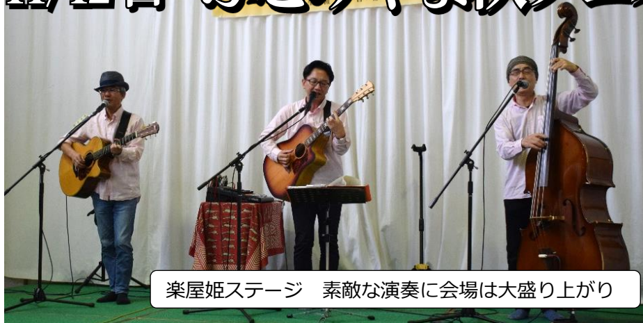
楽屋姫ステージ 素敵な演奏に会場は大盛り上がり